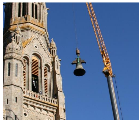
Phot. B. Raymond 17 oct. 2016

Nomen ejus Maria ann Dom MDCCCLXI Pio IX P.M. Crosnier paroch C. M. Lapierre patr Rosal Durand matr